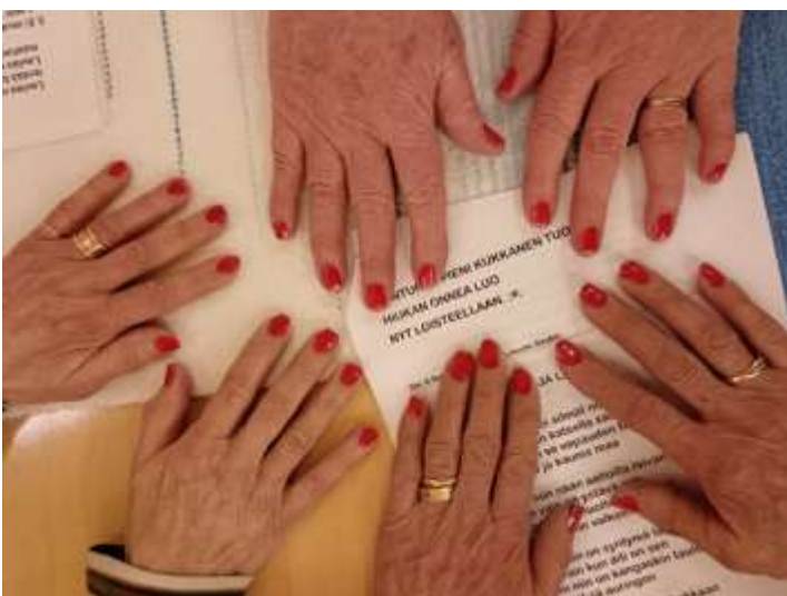
Naistenpäivän iltaa maaliskuulta