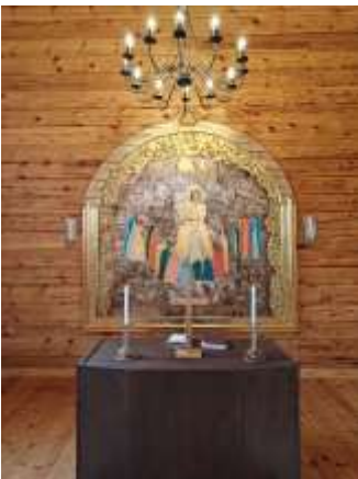
Oli ilo vihkiä Paanukirkossa (Keminmaa) simolainen pariskunta

Kastetoimitukset kuuluvat papin perustyöhön, jotka pappi hoitaa käytännössä yksin. Kastetilaisuudessa kohdataan ja ollaan läsnä isossa juhlassa. Nämä tilaisuudet on hoidettu hyvin. Kastetilaisuudet suunnitellaan yhdessä perheen kanssa ja heidän toiveitansa ja tarpeitansa kuunnellen. Kasteperheitä kutsutaan myös seurakunnan toimintaan, kerhoihin sekä jumalapalveluksiin.