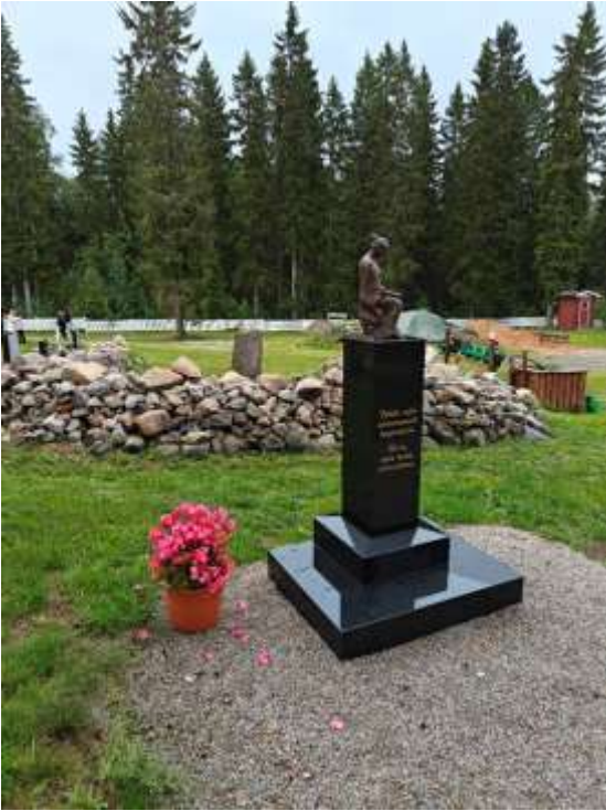
Tyhjän sylin muistomerkki