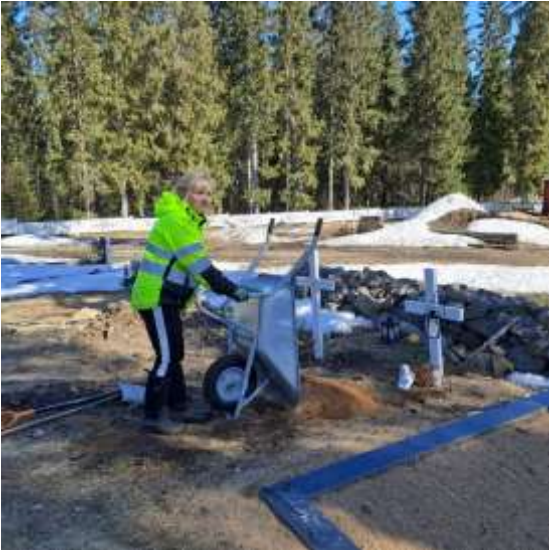
Seurakuntamestari Pirjo Pakanen kevättöissä

Tuhkahautauksista suoritettu uusiin arkkuhautoihin 1 (v.2023/1), aiemmin lunastettuihin arkkuhautoihin 7 (v.2023/15), uusiin urnahautoihin 1 (v.2023/0) ja muistolehtoon 2 (v.2023/1).