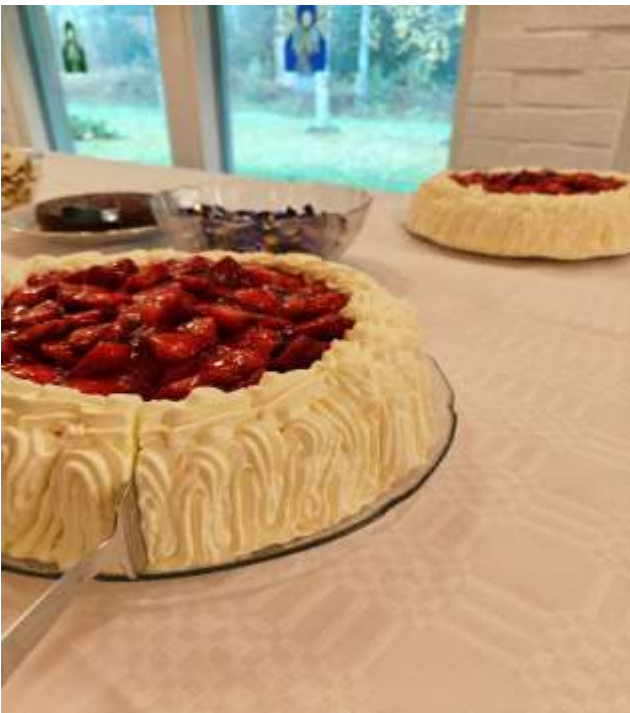
Kevään yhteiset syntymäpäiväjuhlat