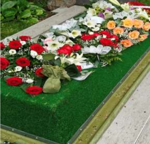
Sun haltuus rakas Isäni, mä aina annan itseni

Yksi merkittävä osa seurakunnallista toimintaa on hautaan siunaaminen. Hautaan siunaamisia on verrattain paljon seurakuntamme alueella. Siunaamiset on hoidettu hyvin ja niistä on saatu hyvää palautetta. Omaisten toiveita ja tarpeita kuunnellaan ja toteutetaan mahdollisuuksien mukaan.