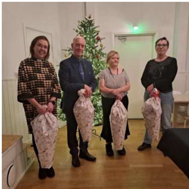
Luottamushenkilöiden ja työntekijöiden yhteisessä joulujuhlassa kukitettiin puheenjohtajisto.

Vuonna 2022 aloitimme myös Kemin seurakunnan kanssa kanttoriyhteistyön, jossa luodaan yhteistyösopimus kanttorien väliselle vapaa-aika suunnitelmalle. Tämä sopimus on ollut hyvin toimiva. Sopimus jatkuu edelleen vuonna 2025.