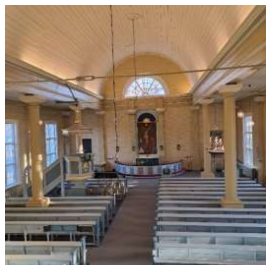
Kirkkosali aurinkoisena arkipäivänä