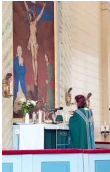
Jumalanpalveluselämän keskuksena on messu

Vuoden aikana veteraanipäivää ja itsenäisyyspäivää vietettiin perinteisin menoin. Yhteistyö kunnan sekä muiden toimijoiden kanssa on tärkeää ja merkittävää. Vuoden yksi upeimmista ja sekä tunteikkaimmista hetkistä on pyhäinpäivän iltajumalanpalvelus, jossa luetaan kaikki vuoden aikana kuolleiden nimet. Vuonna 2024 pyhäinpäivänä seurakunta jalkautui myös hautausmaalle.