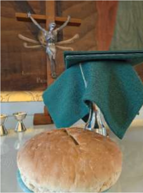
Ehtoollishetki rippikoululaisten kanssa Simon kirkossa