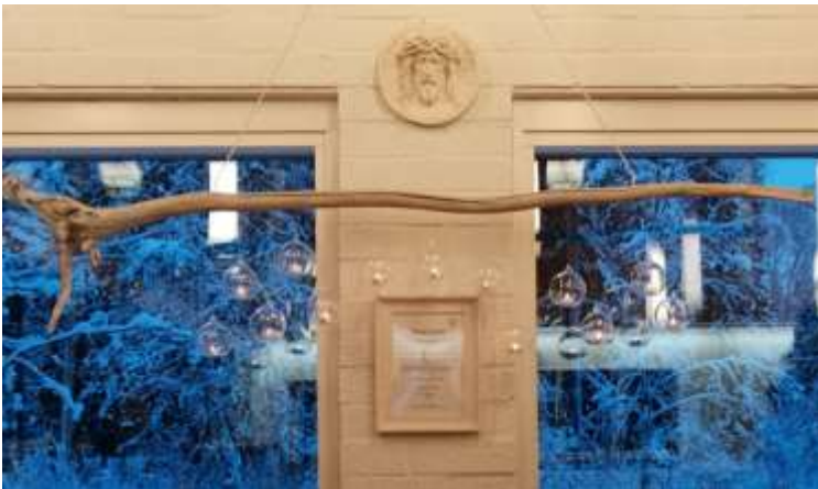
Kastepuu, siunattiin käyttöön 7.1.2024