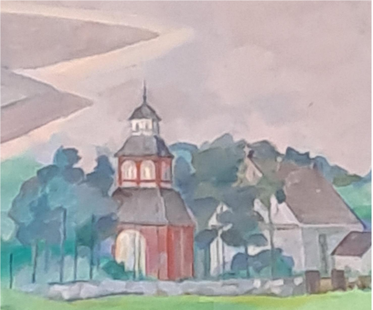
Simon seurakuntakeskuksen alttaritaulusta, taiteilija P. Tolonen 1994