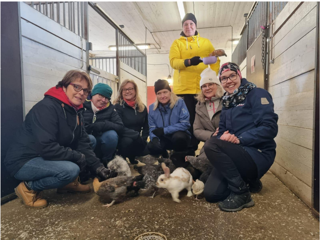
Henkilökunnan työhyvinvointipäivä toukokuussa 2023

Kerhovierailut, tilaisuudet ja tapahtumat ovat tärkeä osa seurakunnan toimintaa. Yhteistyö kunnan kanssa on moniulotteista ja rikasta. Seurakunnan työntekijöinä olemme läsnä ja kohtaamme jokaisen kunnioittavasti ja arvokkaasti.