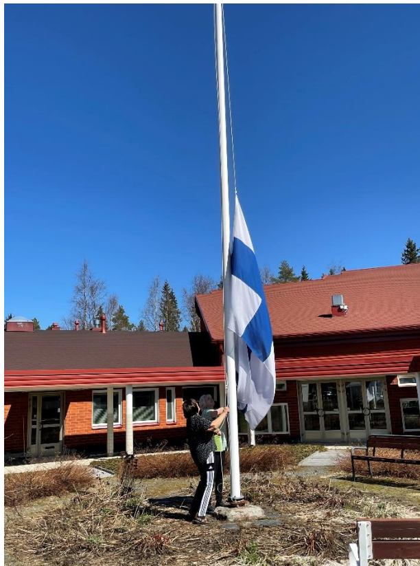
Lipun nosto 24.4.2022

Seurakuntakeskus sijaitsee osoitteessa Simontie 6 Asemakylällä. Talo palvelee seurakunnan jumalanpalvelusten, omien kerhojen ja tilaisuuksien pitopaikkana. Myös ulkopuoliset voivat vuokrata tiloja perhejuhlien ja muiden tilaisuuksien pitopaikaksi. Seurakuntakeskuksessa on myös kirkkoherranvirasto ja työntekijöiden toimistotilat.