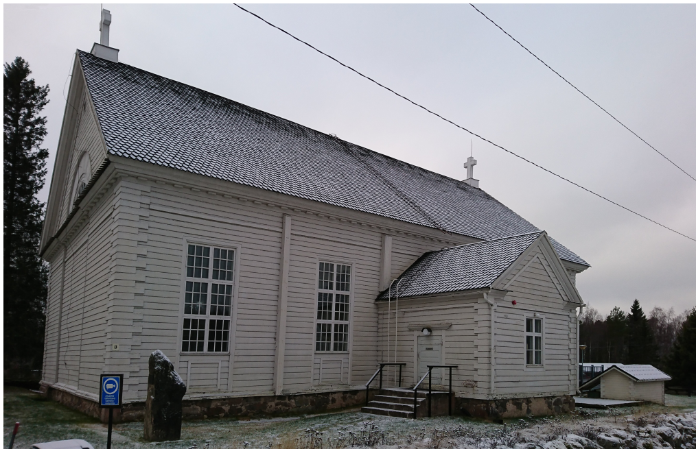
Kirkon pohjoispuoli, sakastin portaissa väliaikaiset kaiteet, kuvattu 10.11.2022