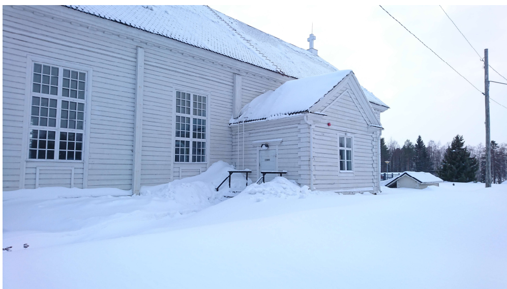
Sakastin itäsivu ja porras, kuvattu 24.3.2023